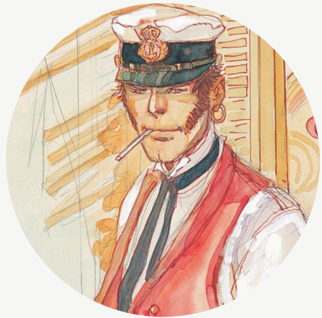
Aix en bulles

Manga AIX'PO : les 24 et 25 avril, la culture japonaise investit la Manufacture avec, entre autres, mangas et cosplays. Payant. Infos